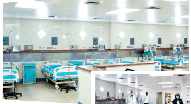
Sala de Emergencia COVID-19, El Tigre