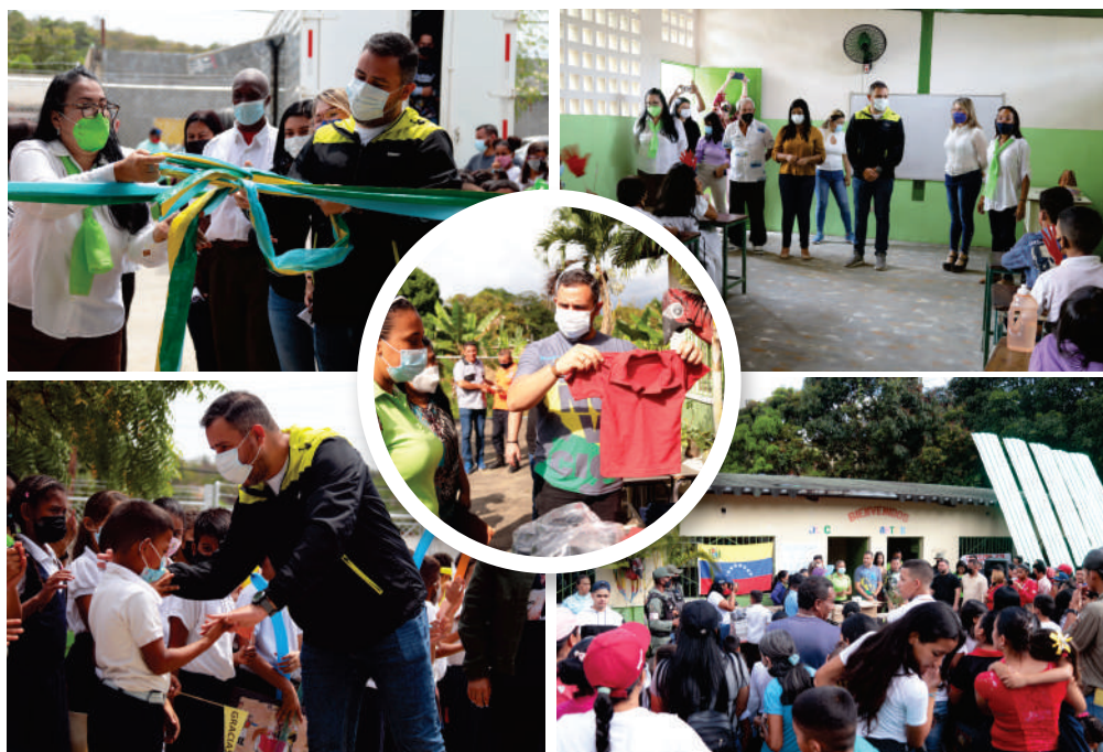
"Obras son amores y están cargadas de amor"

Asimismo, fue reacondicionada la E.B.N. Creación "San Diego de Cabrutica" en el municipio Monagas , esta última en respuesta al compromiso adquirido por el mandatario regional en campaña electoral.