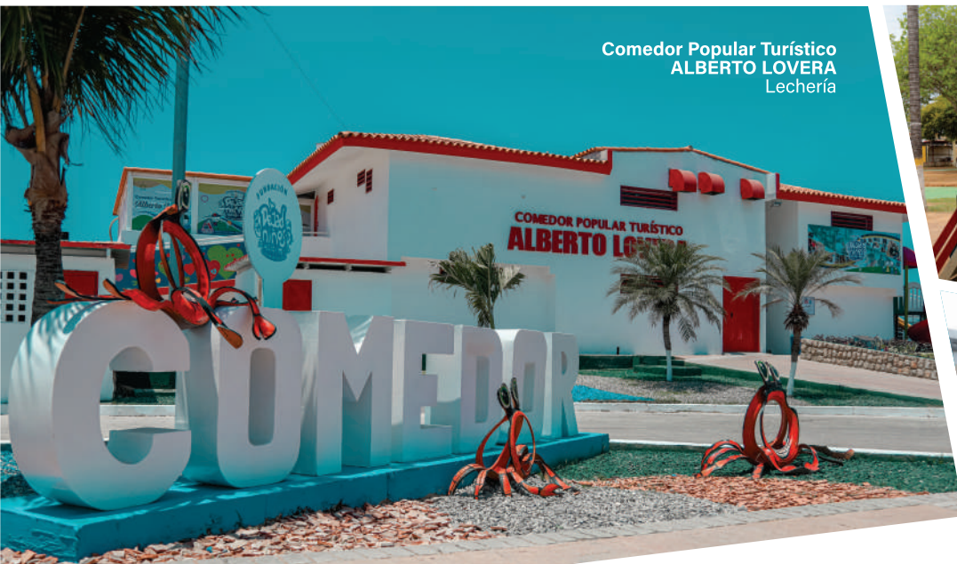
Comedor Popular Turístico ALBERTO LOVERA Lechería