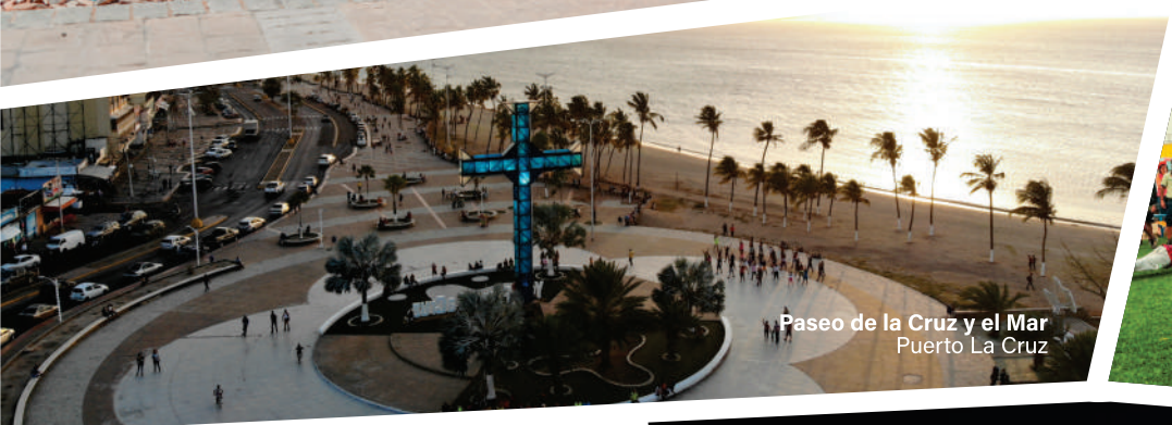
Paseo de la Cruz y el Mar Puerto La Cruz