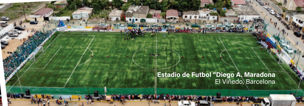
Estadio de Fútbol "Diego A. Maradona" El Viñedo, Barcelona