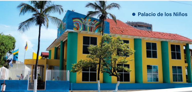
● Palacio de los Niños