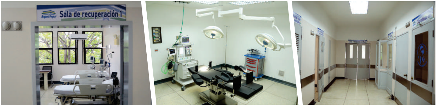
Piso 5, Hospital Dr. Luis Razetti

F ortalecer el Sistema Público de Salud es prioridad para el Gobierno Bolivariano de Anzoátegui que destina el mayor porcentaje presupuestario hacia el ámbito social con énfasis en este sector.