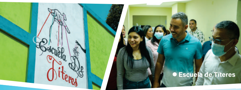
● Escuela de Títeres