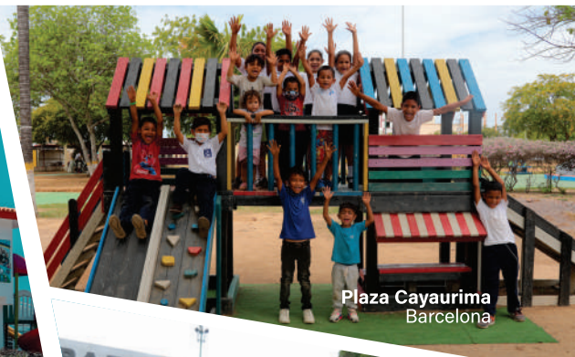
Plaza Cayaurima Barcelona