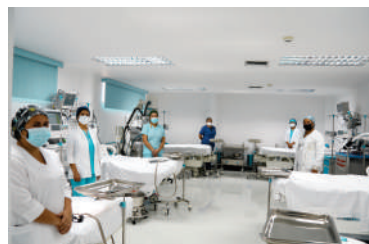
Unidad de Cuidados Intensivos (UCI) Hospital Pediátrico Rafael Tobías Guevara

Vale destacar que la gestión apunta hacia garantizar el derecho a la salud con una proyección de inversión del 35% del presupuesto en materia social, priorizando el sector sanitario con la asignación de 12 millones de bolívares .