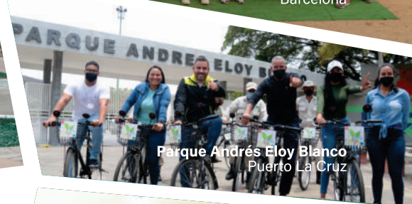
Parque Andrés Eloy Blanco Puerto La Cruz