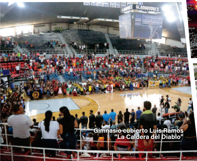
Gimnasio cubierto Luis Ramos "La Caldera del Diablo"