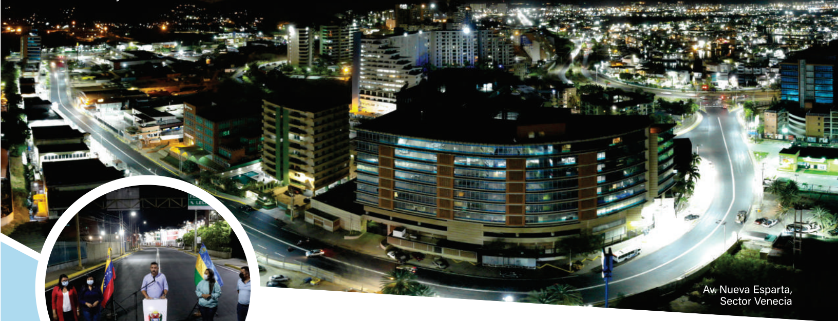
Av. Nueva Esparta, Sector Venecia

A través del Plan Especial de Asfaltado se han colocado cerca de 50 mil toneladas de asfalto, especialmente en la recuperación de las troncales 9 y 16 en distintos tramos.