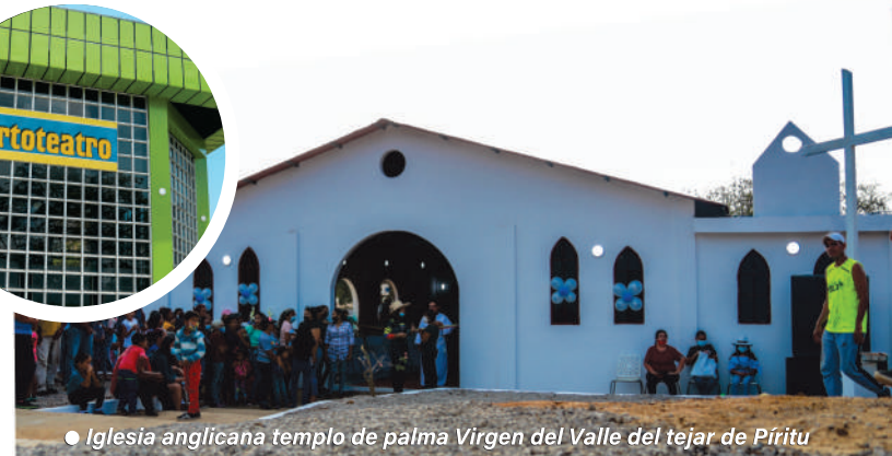
● Iglesia anglicana templo de palma Virgen del Valle del tejar de Píritu