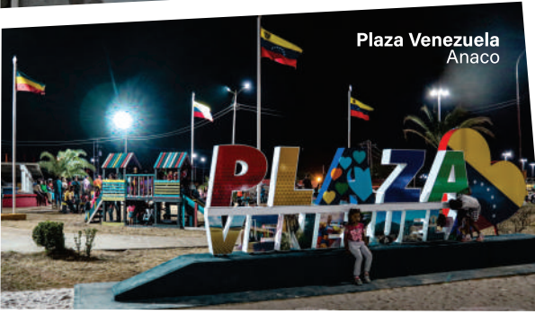
Plaza Venezuela Anaco