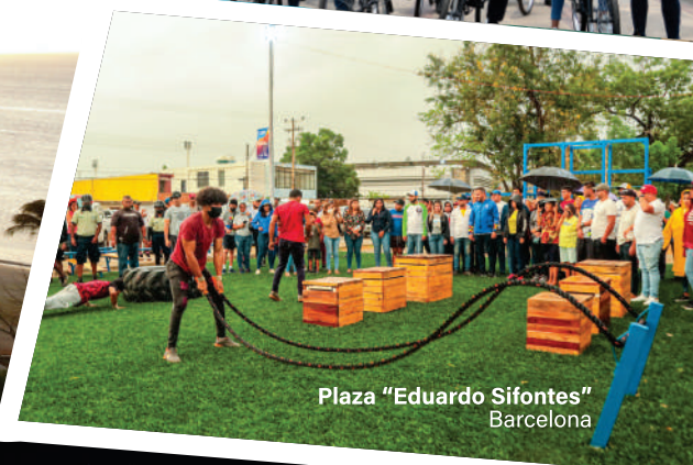
Plaza "Eduardo Sifontes" Barcelona