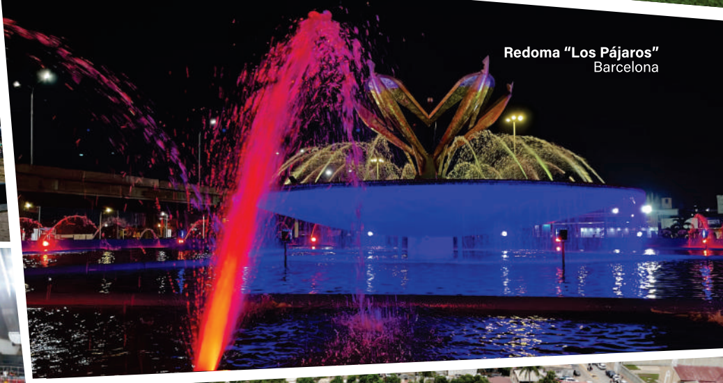
Redoma "Los Pájaros" Barcelona